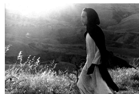
© Evangile selon saint Matthieu- Pasolini