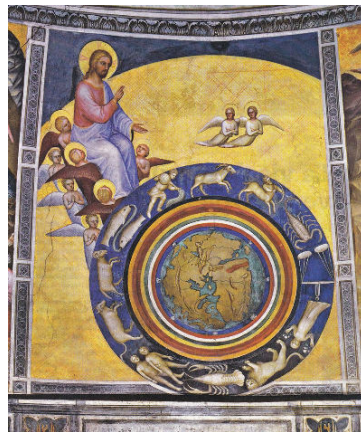
La création du monde, fresque de Menabuoi, baptistère de Padoue (Italie) vers 1376.

Notre Dieu Créateur est Père. Cette création, Il l'a voulue par débordement d'amour Et Il continue à l'aimer. Dieu se réjouit de la beauté de sa Création, Il la bénit. Il veut se laisser connaître à travers elle car il y a laissé sa trace. Il veut communiquer avec elle et Il l'écoute. Il prend soin d'elle, Il la porte, et fait