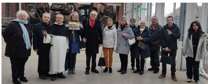
Après la collégiale Saint-Pierre de Douai, visite du Centre minier de Lewarde.